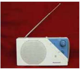
防災行政無線戸別受信機

転入してきたときは、防災行政無線戸別受信機をご家庭に取り付ける申し込みをしてください。また、転出される場合も役場へご連絡ください。