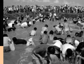
7 / 31~8 / 1 猛暑の中で第21回海浜まつり