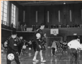
3 / 20 コンサドーレ札幌サッカー教室が本町で