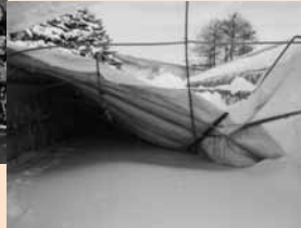
1 / 13~15 記録的な大雪で被害発生