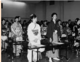
1 / 11 45人が出席した町成人式