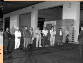
9 / 13 カントリーエレベーターへ新米初出荷