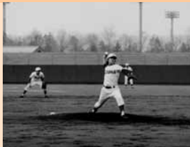
5 / 19 厚真高校5年ぶりに室蘭支部予選に出場