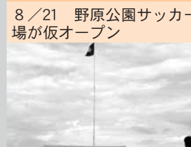
8 / 21 野原公園サッカー場が仮オープン