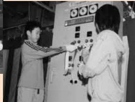
3 / 26 厚真浄化センターで通水式