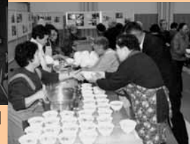
11 / 24 町福祉大会で災害時に備え炊き出しの実演