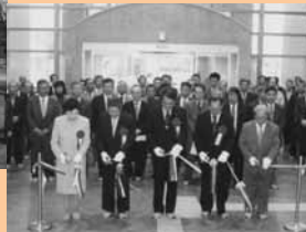
4 / 12 総合ケアセンター「ゆくり」が開所