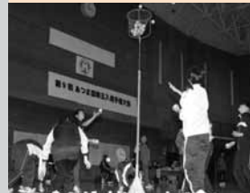
11 / 14 第9回あつま国際宝入選手権が開催