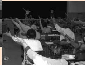
5 / 27 高齢者大学で学生がチェアピクニックに挑戦