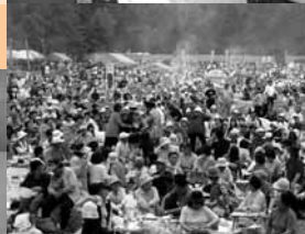
6 / 19~20 第32回田舎まつりで多くのにぎわい