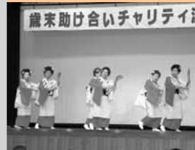
12 / 1 盛會に歳末助け合いチャリティ演芸大会