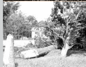
9 / 8 台風18号で停電や倒木などの被害