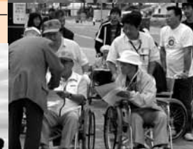
8 / 28 初めて車いすマラソンが市街地で開催