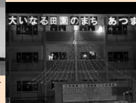
師走の空にともるイルミネーション(表町公営住宅)