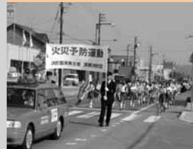
10 / 18 秋の火災予防運動で市街地をパレード