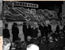
10 / 30 名誉町民谷内信雄氏の町葬が執り行われる