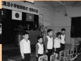
2 / 29 103年の歴史に幕。鹿沼小閉校式