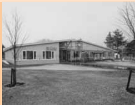
4 / 1 京町保育園が新設され開園