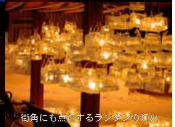
街角にも点灯するランタンの灯火