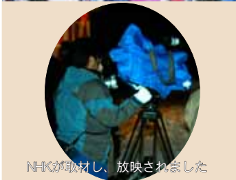
NHKが取材し、放映されました