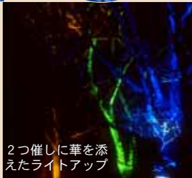
2つ催しに華を添えたライトアップ