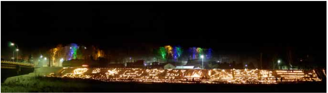
第5回ランタン祭り