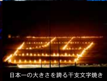
日本一の大きさを誇る干支文字焼き