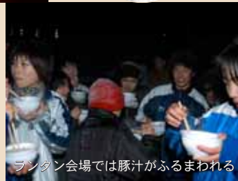
ランタン会場では豚汁がふるまわれる