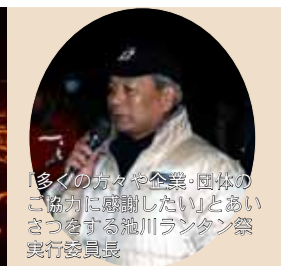
「多くの方々や企業・団体の協力に感謝したい」とあいさつをする滝川ランタン祭実行委員長