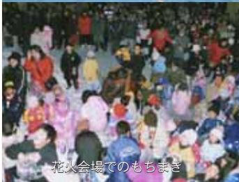
花火会場でのもちまき