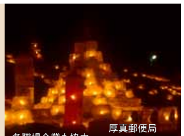
厚真郵便局 各職場企業も協力 北電苫東厚真発電所