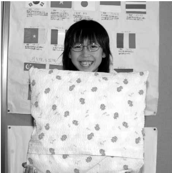
かみあつしよう ねん 上厚真小 4年