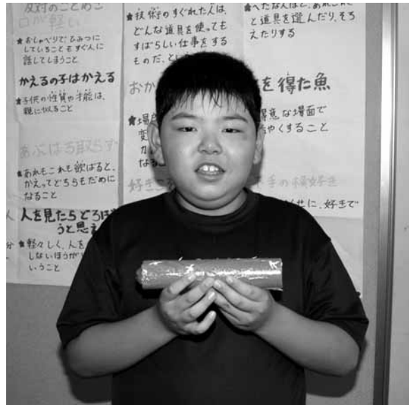
かみあつしよう ねん 上厚真小 4年