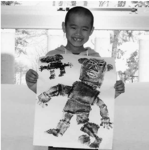
かみ あつ ましろう ねん 上厚真小 1年