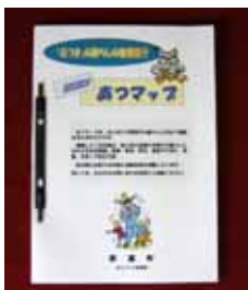
▲作製したあつまっぷ