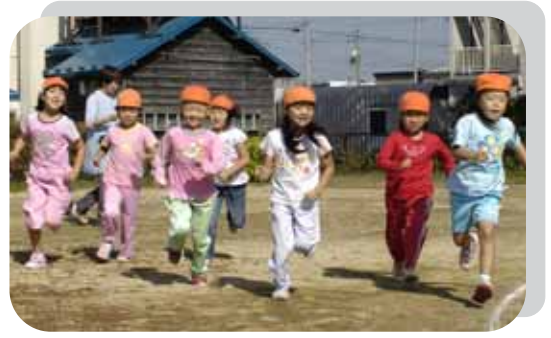
▲京町保育園マラソン大会 (10月16日)