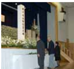
▲昨年の戦没者追悼式