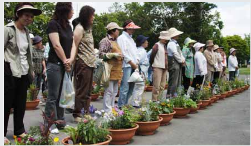
◀ 昨年行われた講習会

■申し込み先 町コミュニティ運動推進協議会事務局 (役場町民課生活環境係 ☎27-2321 内線232)