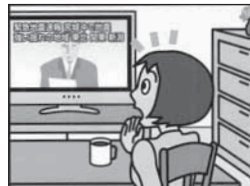
「緊急地震速報」 強い揺れが来ます (揺れの予告)