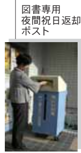
用日返却 祝日返却 専用ポスト 図書専用 夜間ポスト

◎ 青少年センターに夜間ポストがあると聞いたのですが、どんなものですか？ ① 青少年センター玄関前に「図書専用夜間祝日返却ポスト」が設置されています。 このポストは、夜間や祝日に青少年センター図書室が休館している時に、借りている本を返すことができます。ポストです。 ◎ 読みたい本が図書室にあるかどうか簡単にわかりますか？ ① 青少年センター図書室には、タッチパネル方式による検索パソコンが設置されています。 指で画面に触れることによって入力し、読みたい本が図書室にあるかどうかわかるほかに、その本が図書室のどこの本棚にあるか表示することができます。 ◎ 話題になっている本が読みたいのですが図書室にはありますか？ ① 図書担当職員が、話題の本、人気となっている本などには、アンテナをはって情報収集し購入しています。 また、リクエストカードに記入していただくか、図書担当職員に申し出すれば、できるかぎり町民