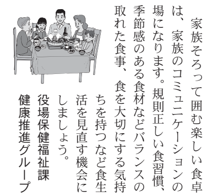
役場保健福祉課健康推進グループ

家族そろって囲む楽しい食卓は、家族のコミュニケーションの場になります。規則正しい食習慣、季節感のある食材などバランスの取れた食事、食を大切にすることを大切にする食生活を持つなど食生活を見直す機会にしましょう。