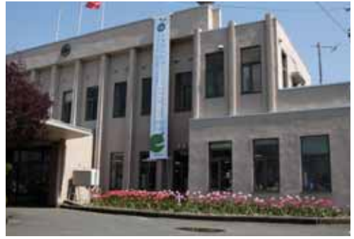
役場庁舎に掲げられた懸垂幕