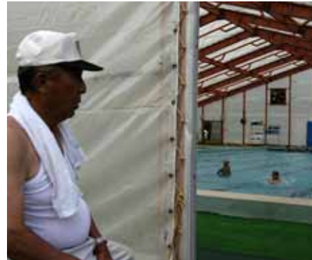
小学校プールの監視。子どもたちの安全を守る片時も気の抜けない仕事