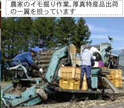
農家のイモ掘り作業。厚真特産品出荷の一翼を担っています