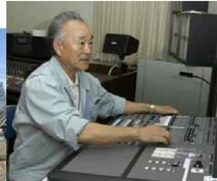
総合福祉センターの管理。以前は町職員が配置されていました