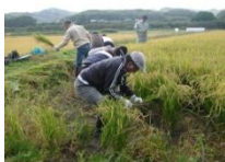
モデルツアーの様子↑↓

都市住民との交流促進を通じてグリーン・ツーリズムを一つの産業として育てていこうと考えているわ。 農業体験や飲食・宿泊に伴う直接的な収入増はもちろん、交流人口の増加は様々な面で厚真町の地域の活性化につながる と考えているの。また、 都市住民との直接的な交流も魅力の一つよ。 昨年、厚真町ではグリーン・ツーリズムのモデルツアーを実施し、札幌からお客さんをお招きし厚真町でいろいろな体験をしてもらったの。参加者の声を聞いてね。