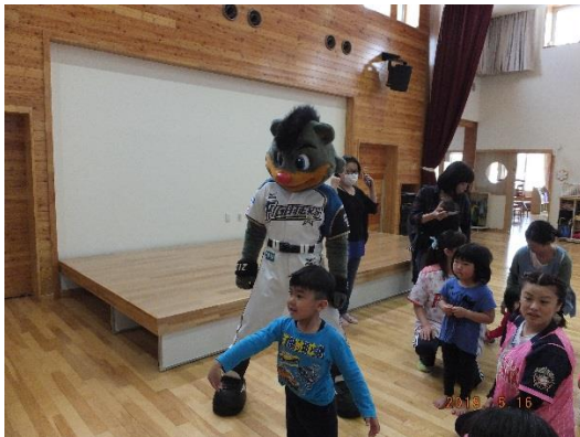
【ストライク ボール投げたよ】