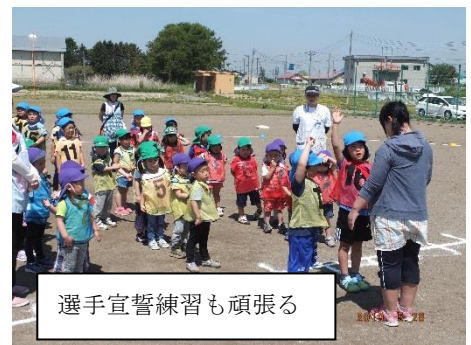
選手宣誓練習も頑張る

フジフィルムスクールフォトですが、今回も文字を写真に入れる事ができます。詳しい内容はフジフィルムから後日、案内が届く予定になっています。