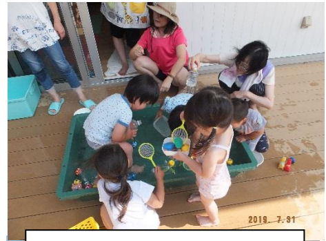
小さいクラスも楽しくおもちゃの金魚すくい水遊び