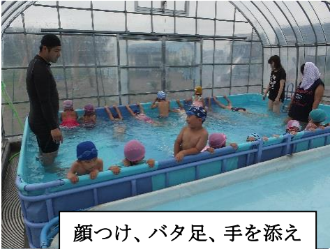
顔つけ、バタ足、手を添えて浮けるかな

8月に入り、暑い日が連日続き子ども達にとっては、水遊びが恋しい日が続きました。いちい組・くるみ組・もみじ組は、園庭のベランダで、おもちゃの魚を浮かべ水遊びを楽しんでくれました。又、こなら組・さくら組・こぶし組は、園のプールで連日顔つけから泳ぎへ体育遊びの先生の指導も受け、クラス毎にしっかり練習したり元気に水かけやっこや水遊びにと楽しんでいます。