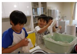
洗い物もばっちり★