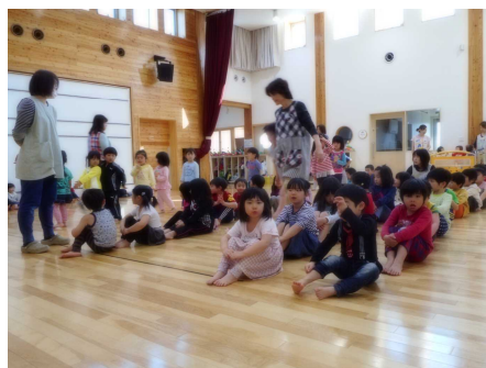
【初めてホールに全員集合しました。】

今年度初めてホールに全員集合しました。おしゃべりに夢中になる子もいなければ、体を動かす子もいません。みんな真剣に話を聞いていました。「一つ上のクラスになったんだから、がんばろう」という気持ちが育ってきていると思います。これから運動会の練習が始まります。体をたくさん動かし、丈夫な体になってほしいものです。