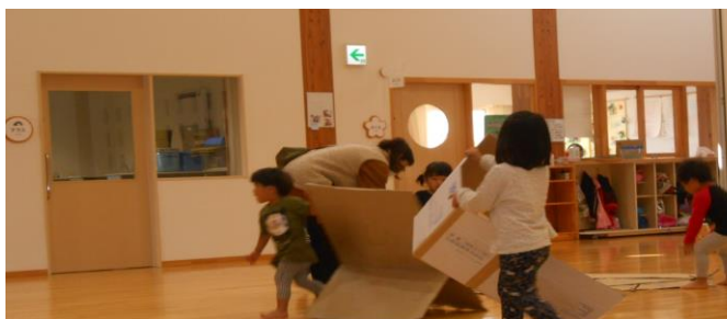
小さいクラスは、ダンボールを利用して「かくれんぼ」早く隠れないと見つっちゃうよ!! 段ボールがうまく開いてくれないので大変でしたね。