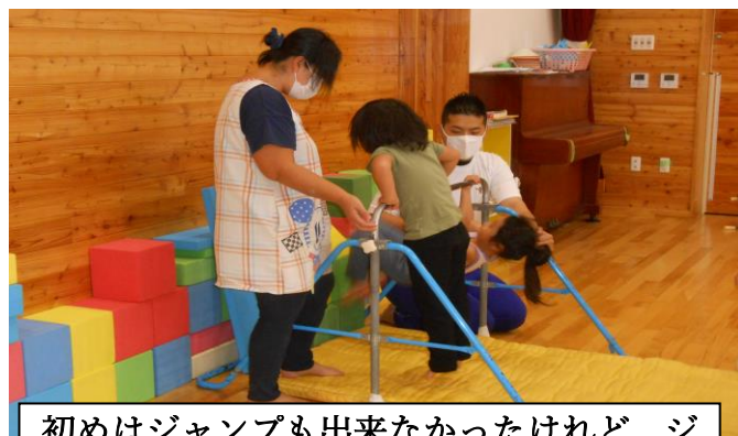
初めはジャンプも出来なかったけれど、ジャンプのコツを覚えると出来るようになりました。