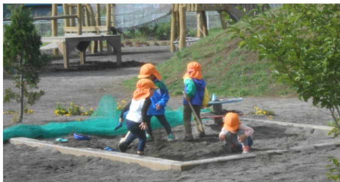
みんなで穴掘り・・・協力して頑張るぞ!! こんな時は子ども同士、協力し合っています。 子ども達も力を合わせるとスゴイ力を発揮!! 大きな穴が出来上がりました。