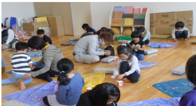
ハロウインのマントづくり。シール剥しに時間がかかるので、お母さんたちにも手伝ってもらいながら、楽しい製作時間となりました。

10月5日・6日・7日の3日間の保育参観には、ソーシャルディスタンスに配慮しながら、参観して頂き、ありがとうございました。体育あそび・製作・園庭あそびなど普段の子ども達の生活を見て頂けたと思います。体育あそびでは年齢に合わせた指導により前回出来なかったことが今回には出来たり、子ども達の成長を感じて頂けたと思います。各クラスのお部屋の構成も、職員が子ども達の様子に合ったあそびを選べるように工夫しています。