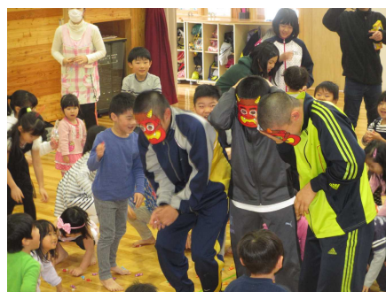
【豆(あめ玉)まきの一コマより】

2月15日(木)は、上厚真小学校の6年生が来園して宮の森っ子たちと遊んでくれました。豆まきならぬ「あめ玉まき」で鬼を退散させました。あめ玉なので鬼さんは、とても痛かったと思いますが、子どもたちは大喜び。この後、お兄さんお姉さんは、手作りの遊び道具を抱えて各教室に入りました。教室からは、大きな笑い声が響いていました。昨年に引き続いての6年生の訪問。子どもたちにとっては、とても楽しみにしている行事の一つになっているようです。6年生のみなさんありがとうございました。