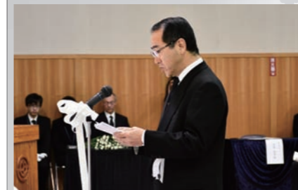
追悼の意を表し、町の復興を誓う宮坂町長