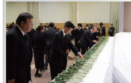
参列者一人ひとりによる献花