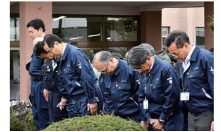
役場前で町職員らが黙とう