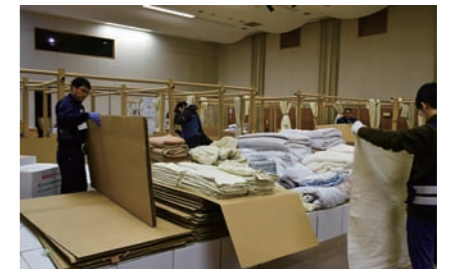
閉鎖された総合福祉センター避難所