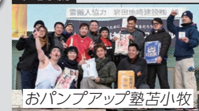
おパンプアップ塾苦小牧