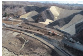
砂利敷の仮道(写真下)と崩土除去作業(写真上)

東和地区の町道新町富里線は、地震による崩土で、一部区間が埋もれてしまったため、砂利敷の仮道を設置します。復旧工事は現在、崩土除去作業を行っており、春以降に舗装や道路排水の整備に着手する予定です。