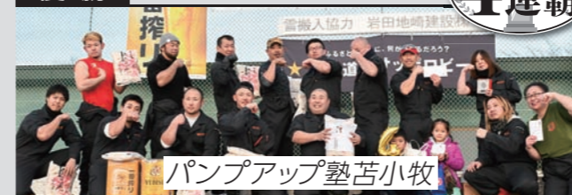
パンプアップ塾苦小牧