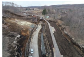
砂利敷の仮道(写真右)と元の道路(写真左)