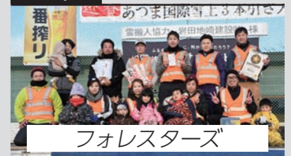
フォレストスターズ