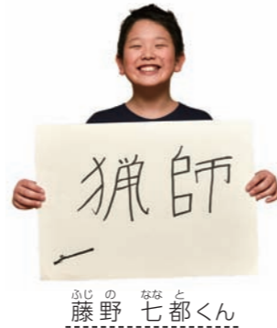
ふじの ななとくん