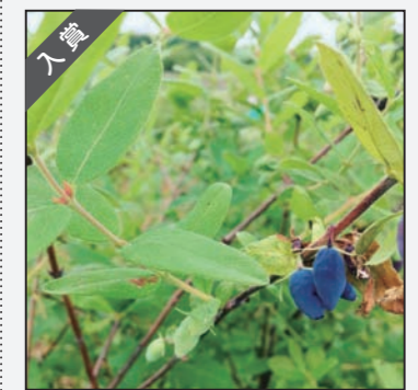
yu35sunmoonさん せっかちさんの実が ちらほら出てきた ハスカップ畑 今年もおいしいハスカップが たくさんありますように