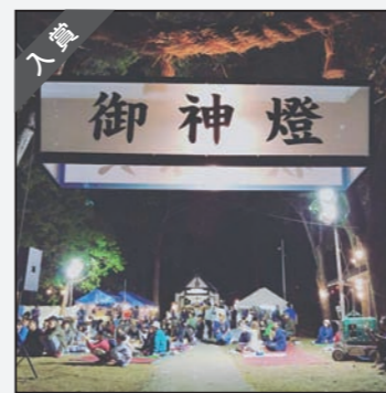
k8111miyashitaさん THE Local 今日は豊丘天満宮の秋祭り☆ Atsuma forever Toyooka forever