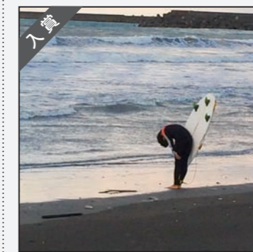
satoshi_marさん 震度7の地震から2週間、この間多くのサーフィン仲間やボランティアさんがルーラル避難地区に手伝いに来てくれました。皆さんのおかげでホームで練習再開することが出来ました！