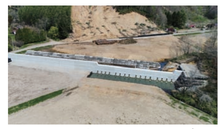
応急対策工事が完了したチカエツ川の砂防えん堤