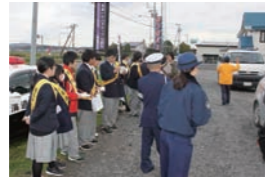
交通安全街頭活動