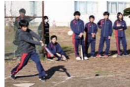
屋外スポーツ大会