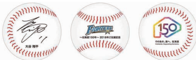
右サイド 正面 左サイド

北海道 150 年となる 2018(平成 30)年に生まれた新生児に、北海道日本ハムファイターズが記念ボールを贈呈します。