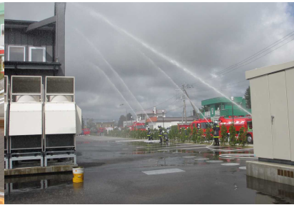
【本格的な放水演習】