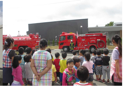
【本物の消防車にビックリ!】