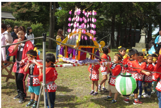
【こぶし組・ワッショイ ♪ワッショイ ♪】