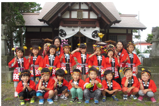
【さくら組さん 少し疲れたかな～?】