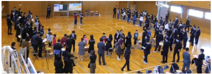
体育館で行われた多くの参観者の中での小5と中3の授業