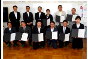
厚真中央小学校会場