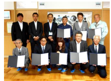
上厚真小学校会場

厚真オートサービス株式会社、味の店ドライブイン本郷 厚真園、有限会社 坂本商事、有限会社 蔵重自工、潮騒ラーメン 有限会社 沼田重機、瀬戸商店