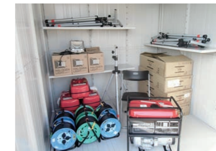
灯り器・発電機など