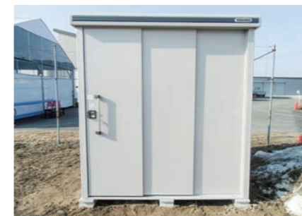
防災備品収納用物置