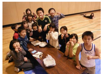
みんなで食べると美味しく倍増☆

10月の活動で作ったふるさと玉手箱が、交流相手の学校から送られてきました。静岡県の清水江尻小学校6年生のみなさんが作ってくれた玉手箱の中身に子どもたちも興味津々。送られてきた箱の中には、七夕祭りの飾り物や紙粘土でできた模型、地域のコトを調べた手作りパンフレットなどが入っていました。担任の先生からのお手紙には「ふるさとのイメージがぴったりな美しい自然に囲まれたところなんだろうな、とみんなで想像しています」とあり、子どもたちがつくった玉手箱が、遠く離れた静岡の子どもたちの手に届き、厚真町のPRに少しでも役に立っていたら良いなと思いました。子どもたちの好奇心をくすぐる面白い活動になったと思います。