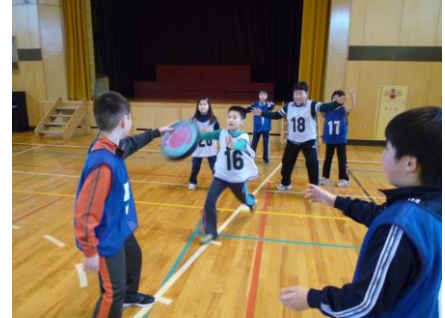
高学年はニュースポーツ（キンボール、アルティメット）を行いました。