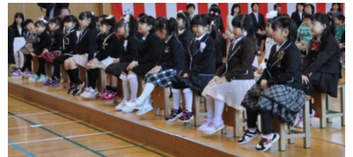
中央小学校入学式(4月7日)

今一度、子どもの安全について各家庭・地域で再確認し、未来を担うかけがえのない子どもたちを守り育てていきましょう。