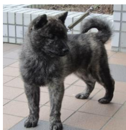
生後3カ月の虎毛犬