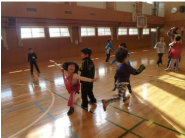
オニごっこやリレーなどでたくさん体を動かしました！