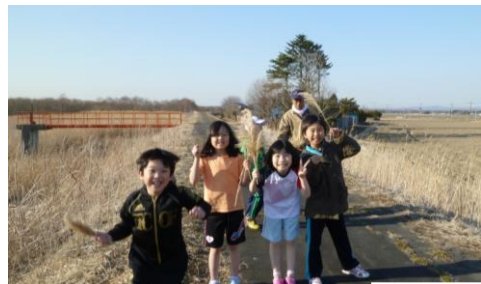
学校林や河川敷までお散歩♪外遊びは楽しいね！