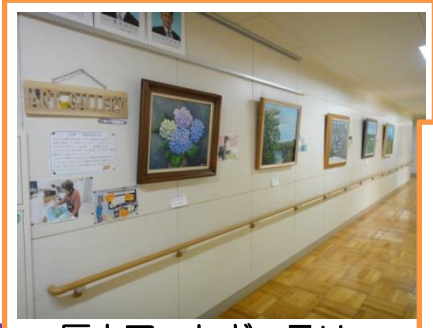
厚中アートギャラリー

厚中アートギャラリーは、いつでも地域の皆さんに開放しています。ぜひ、お立ち寄りください。