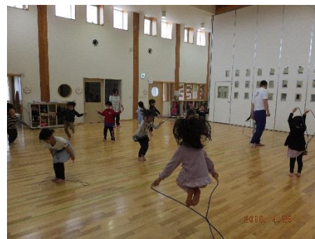
いろし組 元気一杯