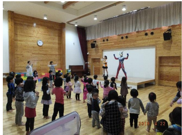
ウルトラマンゼロとかっこいいポーズ