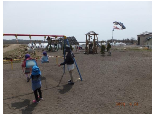
【園庭で遊ぶ子ども達と鯉のぼり】

これから運動会の練習が始まります。体をたくさん動かし、丈夫な体になってほしいものです。