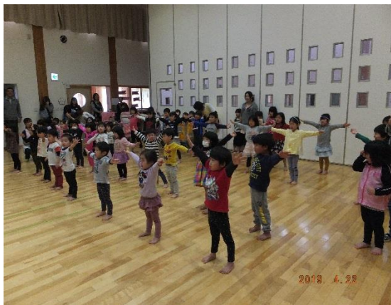
みんな元気一杯に踊ってくれました