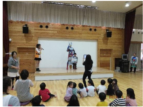
急遽受け取る代表に こぶしの 〇〇〇〇さんと〇〇〇〇 〇〇〇〇ちゃんに頑張ってもらいました