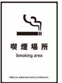
特定屋外喫煙場所