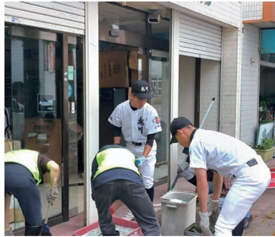
様々なボランティア活動を行う野球部員（左：被災農家の復旧作業 右：被災店舗の清掃）