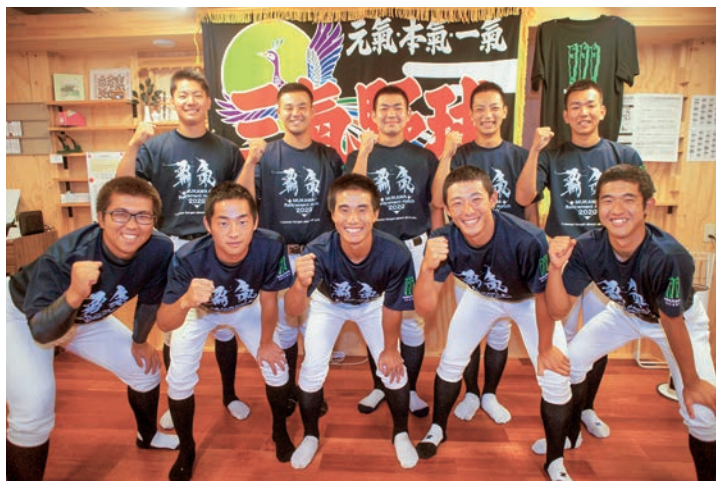
約2年間を仮設生徒寮で共に過ごした野球部3年生一同

んからご支援をいただき、ありがとうございます。彼らは震災の経験を活かし、どこかで困っている人がいれば、その人のために手を差し伸べることが出来る大人になってくれると思います。これからも本校野球部への応援をどうぞよろしくお願いいたします。