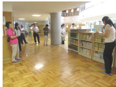
学校図書館の環境整備の仕方を学ぶ参加者

なお教育委員会では、学校図書館の環境整備を行う図書ボランティアの方を募集していますので、お問い合わせください。