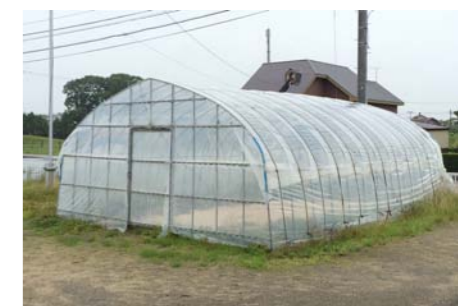
旧宮の森保育園プール用ビニールハウス

お問い合わせ先 町民福祉課 子育て支援グループ(総合ケアセンターゆくり内) ☎ 26-7871