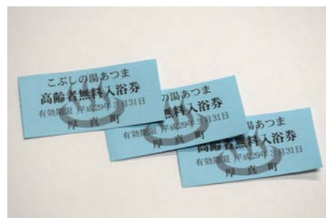
こぶしの湯あつま 無料入浴券

お問い合わせ先 町民福祉課 福祉グループ(総合ケアセンターゆくり内) ☎ 26-7872