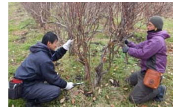
ハスカップの枝のせん定を勉強中!