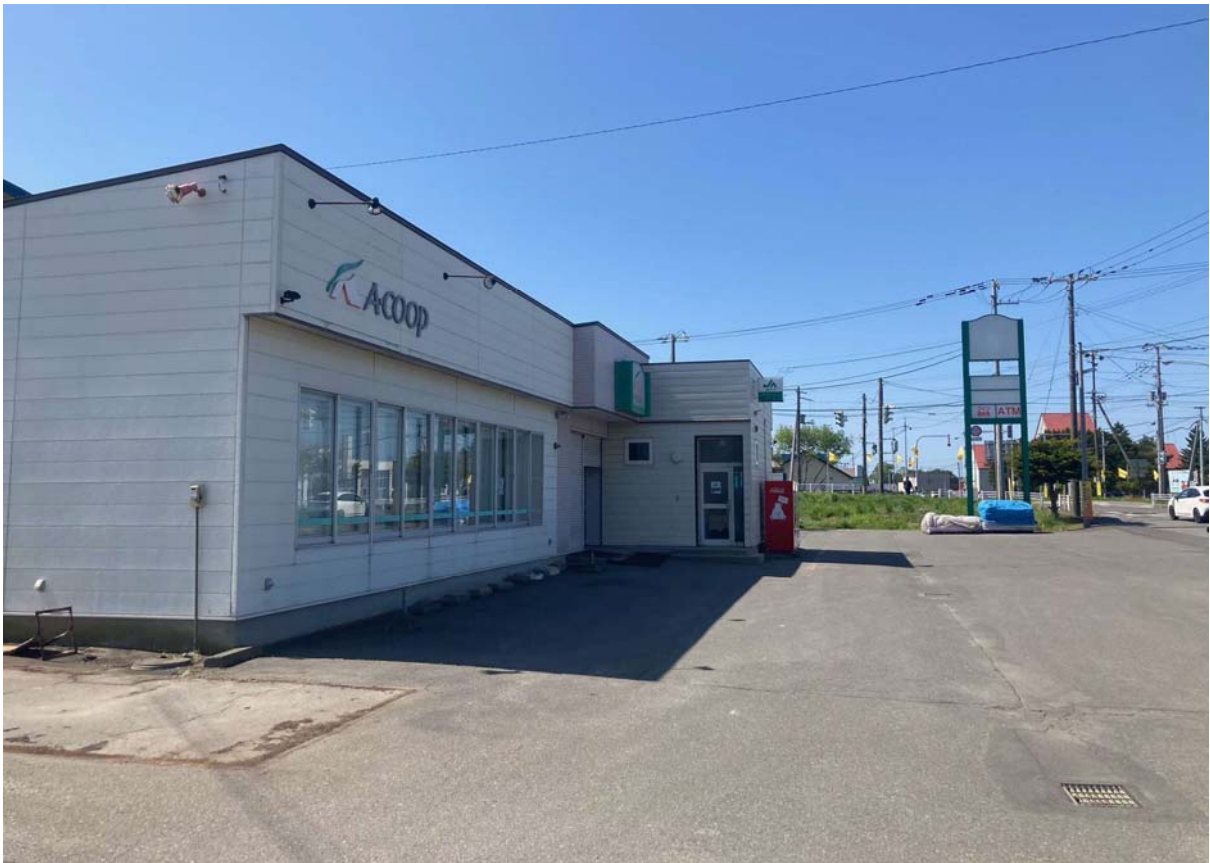
▲改修を予定している上厚真市街地店舗