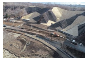
砂利敷の仮道(写真下)と崩土除去作業(写真上)