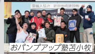
おパンプアップ塾苦小牧