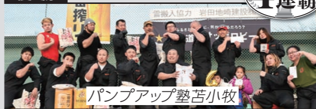
パンプアップ塾苦小牧