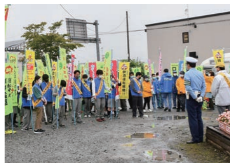
交通安全啓発する生徒たち

2年生13人と3年生17人が参加し、町のスクールバスで現地まで移動しました。開会式で、町交通安全推進委員会委員長や苫小牧署交通課長が「6年前の小樽海水浴場での飲酒ひき逃げ事故がきっかけとなり、7月13日が『飲酒運転根絶の日』に設定され、道民一丸となり取り組んでいる」とあいさつ。交差点の沿道に並んでのぼりを立て、「旗の波作戦」を展開しました。