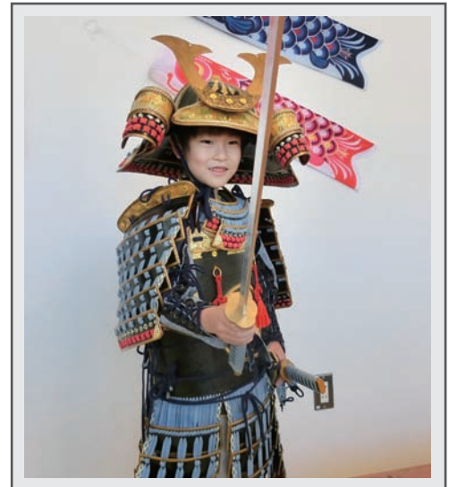
手づくり甲冑を着て記念撮影