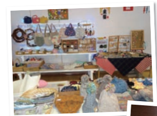
◁ハンドメイド小物

このほか、館内には厚真町油絵の会の絵画や古布手芸の会「夢遊布」の皆さんが制作した作品も展示しています。