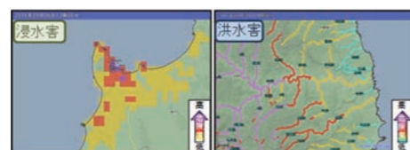
△ 大雨警報(浸水害)の危険度分布(左)と洪水警報の危険度分布(右)

大雨・洪水警報が発表されたときに、どこで実際に危険度が高まっているのかを地図上に色分けして表示しました。