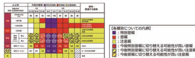
△ 危険度が高まる時間帯を時系列に色分けした図表

これまでは文章のみで発表されていた気象警報・注意報を、一目で分かるように、危険度を時間ごとに色分けして視覚的に分かりやすくしました。