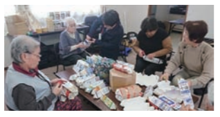
仮設団地の談話室で行われた牛乳パックの座椅子づくり

隣の距離がある地域が多いのは北海道の特徴ですが、仮設住宅で培われた支えあいの意識や仕組みを、いかにこれからの地域づくりに繋げていくかということも大切になってくるのでしょうか。