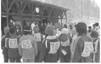
スケート記録会開会式