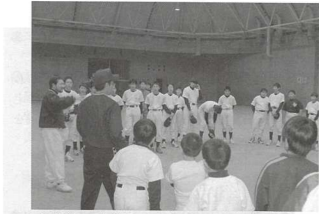
円陣を組んで指導を受ける少年団員と中学生

1月31日、スタードームで初めて合同練習が行われ、約60人の少年団員と中学生が、大きな声を出しながら練習する姿が見られました。