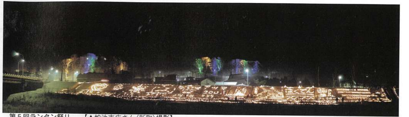
第5回ランタン祭り