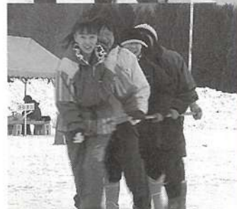
（スケートをはかないみかんひろい競技）