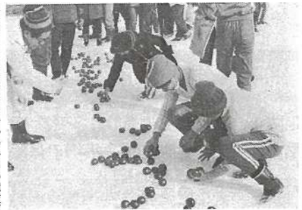
二月二日町主催で、本郷町営スケートリンクにおいて、第一回町民体育祭冬季大会を開催しました。