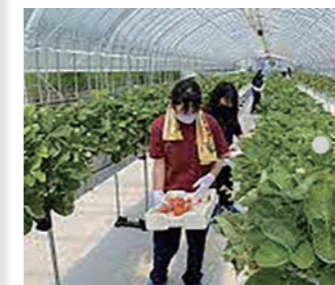
農業体験をする生徒

禍で制約がある中での実施でしたが、創意工夫しながら取り組んだことは、生徒たちの記憶に残ると思えます。 ■インターンシップ農業体験1年(7月21日) 地域に根ざした特色ある取り組みの一環として、本町の基幹産業である農業体験を実施しました。町のスクールバスで、農業担い手センター(旧富野小学校)に移動し、ホウレン草・イチゴ・ブロッコリーの収穫を体験しました。農業担い手センターのみなさんにお世話になりました。