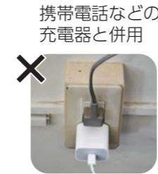
携帯電話などの 充電器と併用