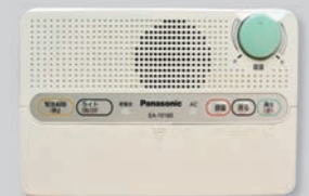
音量調整ダイヤルが緑