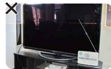
居間のテレビや冷蔵庫など電波を発生する家電に注意！

戸別受信機の近くにテレビや冷蔵庫、電子レンジ、IHクッキングヒーターなどがあると、電波の干渉を受けることがあります。