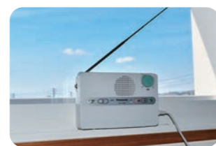
家電などから遠ざけて窓の近くに移動する

大半のケースは、これらの対策で解消されますが、さまざまな要因で正常に受信できない場合があります。改善されなければ、防災グループまでご連絡ください。