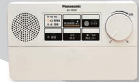
音量調整ダイヤルが白

町民の皆さんのご協力により、令和3年度に町内の全ての防災行政無線のデジタル化が完了しました。デジタル化によって、音声が明瞭になり通信エリアが拡大する(一部地域除く)といったメリットがある反面、使い方によっては放送が途切れることがあります。主な原因や解消法を紹介します。