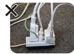
集中タップを利用 (タコ足配線)

防災行政無線の戸別受信機は、電源コードを差すコンセント周辺から電波の影響を受けることがあります。