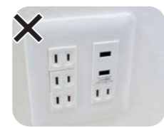
USB付コンセントの 重複利用